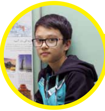
دانش آموز پایه پنجم دبیرستان علامه طباطبایی واحد آشناسان علی افشاری

اول که اومدم اینجا خیلی غریب بودم اما به کمک همکلاسی هام جذب محیط شدم. معلم و بقیه کادر مدرسه برخورد صمیمانه‌ای دارند. در سال جدید آرزوی موفقیت برای همه اولیا و معلم‌ها این دبستان دارم.