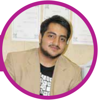
دانش آموز پیش‌دانشگاهی دبیرستان علامه طباطبایی واحد دکتر فاطمی افشین مشفق

اول که اومدم اینجا خیلی غریب بودم اما به کمک همکلاسی هام جذب محیط شدم. معلم و بقیه کادر مدرسه برخورد صمیمانه‌ای دارند. در سال جدید آرزوی موفقیت برای همه اولیا و معلم‌ها این دبستان دارم.