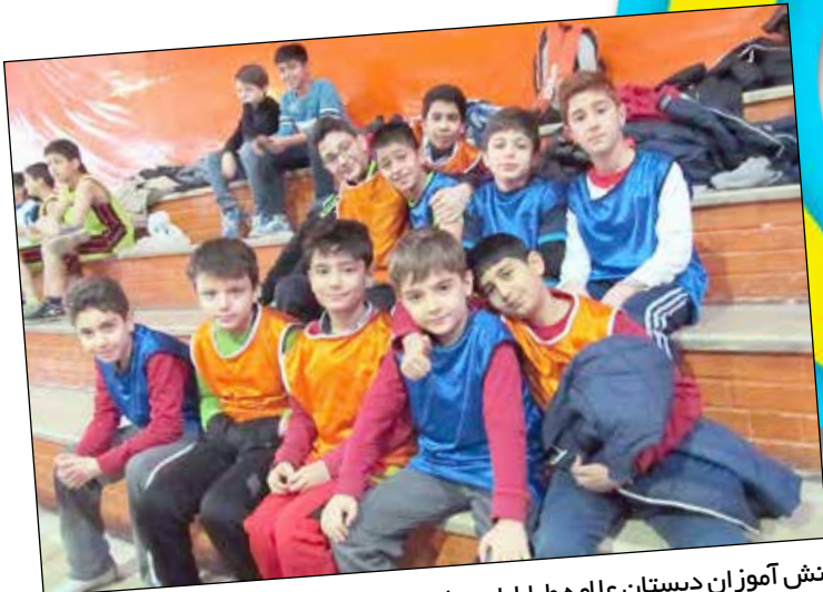
شرکت دانش آموزان دبستان علامه طباطبایی واحد مرزداران در مسابقات بومی - محلی

● برگزاری برنامه جشن بزرگ من و پدر بزرگم که با هدف تکریم پدر بزرگها و سالمندان برگزار شد از پدر بزرگهای عزیز دانش آموزان دعوت گردید تا یک روز را در جمع نوه و فرزندان خود سپری نمایند.