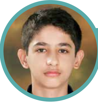
دانش آموز پایه هشتم مدرسه راهنمایی علامه طباطبایی واحد گلستان سینا خانی

روز من نوروز من - کو هفت سینت پس کجاست؟ من برایت سیب می‌چینم دگر سینت کجاست؟ سین اول سادگی را من خودم پیدا کنم حال گویی سادگی در قلب مردانت کجاست؟ خنده‌ای از روز نو دیدم ولی امروز من مرگ نو دیدم نفهمیدم دگر روزت کجاست! فرا رسیدن نوروز را به تمامی دوستان و هم‌نوعان تبریک عرض می‌کنم! با امید تحول ما در روز دیگر.