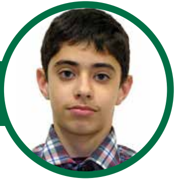
دانش آموز پایه هشتم مدرسه راهنمایی علامه طباطبایی واحد میرداماد دابیال جمشیدی

رسیدن فصل شکوفه‌ها رقص گل‌های بهاری رویش گل‌های آبی و باطراوت شدن طرح‌های قالی و فرارسیدن خجسته عید باستانی نوروز را به دانش‌آموختگان مجتمع علامه طباطبایی تبریک می‌گوییم.